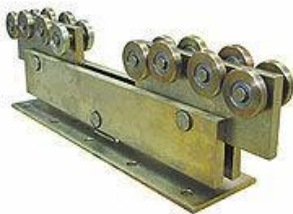
VO 601 7 436,- Dvojity kyvny nosny vozíček pro výrobu samonosné posuvné brány do 10m, pouzdřená ložiska, sulfátovaný ( použijte 2ks pro max. zatížení 800kg), max. výnos 10m, do C profilu CP 555