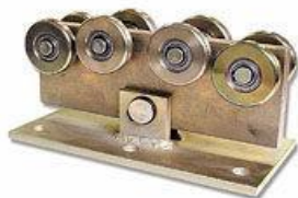
VO 555 2 476,- Kyvny nosny vozíček pro výrobu samonosné posuvné brány do 6,5m, pouzdřená ložiska, zinkovaný ( použijte 2 ks pro max. zatížení do 600kg), max. výnos 6,5m, do C profilu CP 555