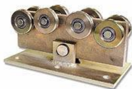
VO 555 2 476,- Kyvny nosny vozíček pro výrobu samonosné posuvné brány do 6,5m, pouzdřená ložiska, zinkovaný ( použijte 2 ks pro max. zatížení do 600kg), max. výnos 6,5m, do C profilu CP 555