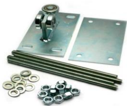
VO 442 740,- Nosný vozíčkový komplet pro výrobu samonosné Posuvné brány do 4,5m, , pouzdřená ložiska Zinkovaný, 2ks na bránu pro max. zatížení 300kg, Pro C profil CP 444