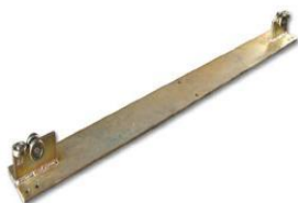
VO 444 2 998,- Nosný vozíčkový komplet pro výrobu samonosné Posuvné brány do 4m, dlouhý 1500mm, pouzdřená ložiska Zinkovaný, pouze 1ks na bránu pro max. zatížení 300kg, Pro C profil CP 444