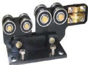
VO 666 8 756,- Dvojity kyvny nosny vozíček pro výrobu samonosné posuvné brány do 15m ( použijte 2ks pro max. zatížení 1 200kg) zapouzdřená ložiska, sulfátovaný, do C profilu CP 666