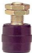
VV-N 45,- nylonový válec