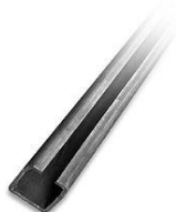
CP 444 356,- CP 555 556,- Nosný C profil bez pozinku, dodávaný po 6m, cena za 1bm, na vozíček VO 444, VO 555