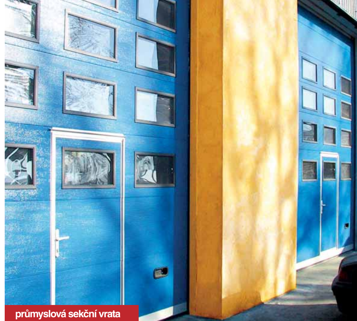
průmyslová sekční vrata